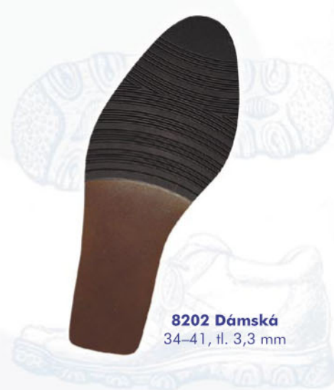
8202 Dámská 34–41, tl. 3,3 mm