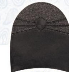
7264 Patník 1–7, tl. 6 mm