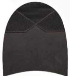
7263 Patník 1–5, tl. 6 mm