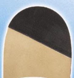
7287 Patník 168–176, tl. 6,5 mm