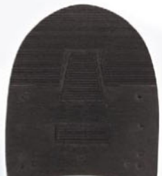
7267 Patník 1–6, tl. 6 mm