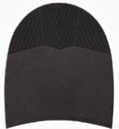
7258 Patník 870–880, tl. 6 mm