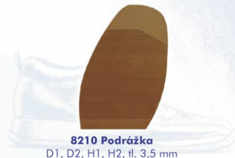
8210 Podrážka D1, D2, H1, H2, tl. 3,5 mm