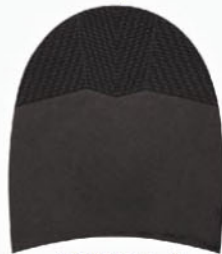
7258 Patník 870–880, tl. 6 mm