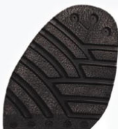
1254 Podrážka 27–33, tl. 9 mm