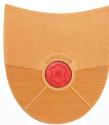
7250 Korunka 162 -174, tl. 7, barva 72 medová