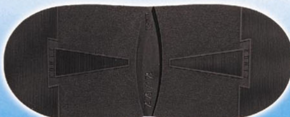
7275 Konty 1, 2, tl. 6 mm