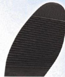
1173 Podrážka 9, 13, tl. 4,5 mm