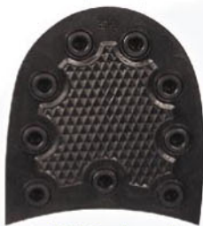
7024 Podpatek 392–398, tl. 10 mm