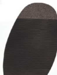
8207 Konty 1–3, tl. 2,5 mm