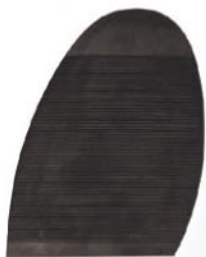
1011 Podrážka 1–5, tl. 2,8 mm