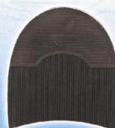
7298 1–5 tl. 12