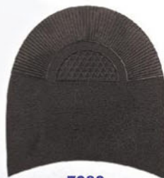
7283 1–6 tl. 6