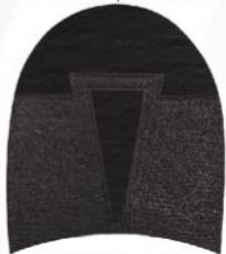
7257 Patník 811–817, tl. 6 mm