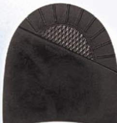
7266 Patník 1–5