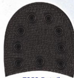
7252 Patník 141–150, tl. 10 mm