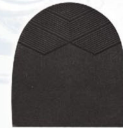
7259 Patník 1–6, tl. 6 mm