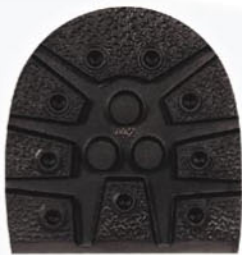
7025 Podpatek 441–446, tl. 13 mm