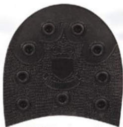
7023 Podpatek 171–176, tl. 15/13 mm