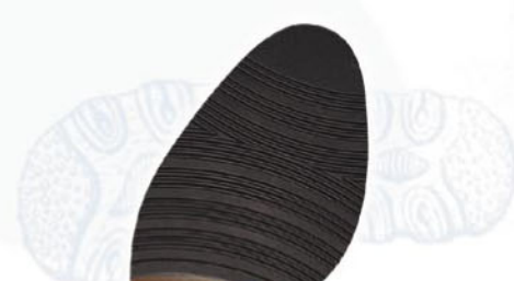
8202 Dámská 34–41, tl. 3,3 mm