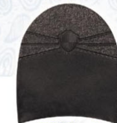
7264 Patník 1–7, tl. 6 mm