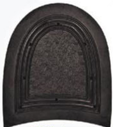
7261 Patník 1–7, tl. 9 mm