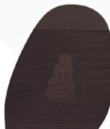
8223 Útah 2–4, tl. 2,8 mm