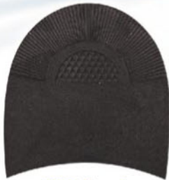
7283 Patník 1–6, tl. 6 mm