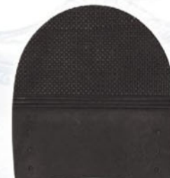
7271 Patník 1–7, tl. 5 mm