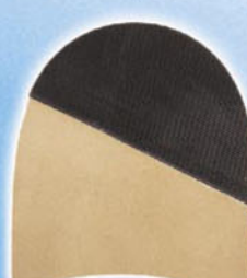
7287 Patník 168–176, tl. 6,5 mm