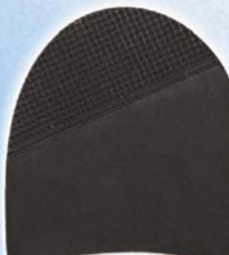
7265 Patník 1–5, tl. 6 mm