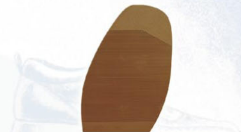
8210 Podrážka D1, D2, H1, H2, tl. 3,5 mm