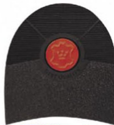
7250 Korunka 162–174, tl. 7 mm