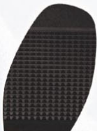
8211 Podrážka D1, D2, H1, H2, tl. 3,5 mm