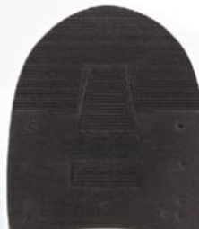
7267 Patník 1–6, tl. 6 mm