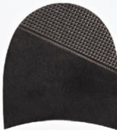
7256 Patník 610–618, tl. 6 mm