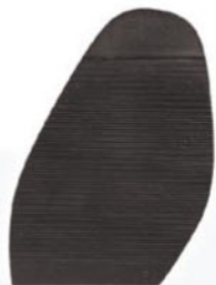
1027 Podrážka 4–6, tl. 2,8 mm