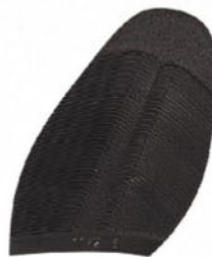
1172 Podrážka 4–10, tl. 2,7 mm