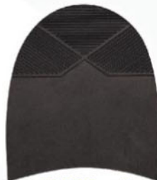
7263 Patník 1–5, tl. 6 mm