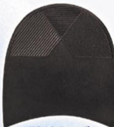
7260 Patník 1–7, tl. 6 mm