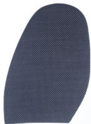
9587 Podrážka F2, H2, tl. 2,5 mm