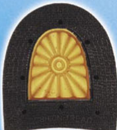
7272 Patník 1–5, tl. 11 mm