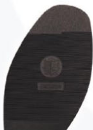
8215 Exclusiv D, H, tl. 2,7 mm