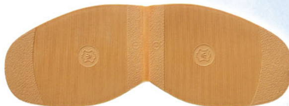
8203 Korunka 1,3, tl. 1,8 mm, barva 72 medová