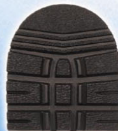
7268 1–6 tl. 6