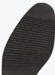
1174 Podrážka 6, 8, tl. 4,5 mm