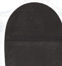
7271 Patník 1–7, tl. 5 mm