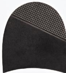
7256 Patník 610–618, tl. 6 mm