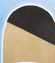
7287 Patník 168–176, tl. 6,5 mm