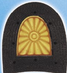
7272 Patník 1–5, tl. 11 mm