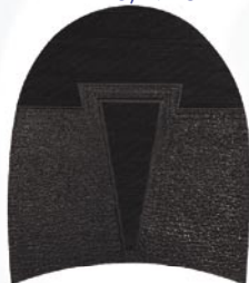
7257 Patník 811–817, tl. 6 mm