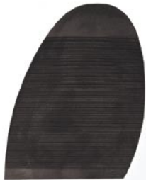
1011 Podrážka 1–5, tl. 2,8 mm