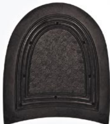
7261 Patník 1–7, tl. 9 mm