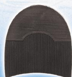
7298 1–5 tl. 12