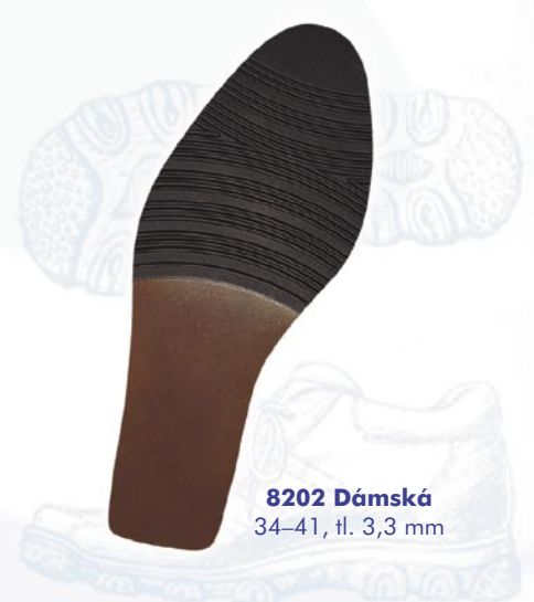
8202 Dámská 34–41, tl. 3,3 mm