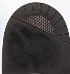
7266 Patník 1–5