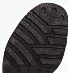
1254 Podrážka 27–33, tl. 9 mm