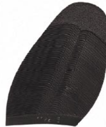
1172 Podrážka 4–10, tl. 2,7 mm