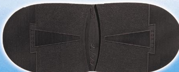
7275 Konty 1, 2, tl. 6 mm