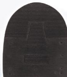
7267 Patník 1–6, tl. 6 mm