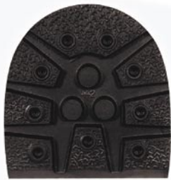
7025 Podpatek 441–446, tl. 13 mm