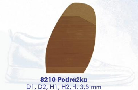
8210 Podrážka D1, D2, H1, H2, tl. 3,5 mm