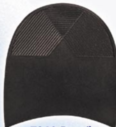
7260 Patník 1–7, tl. 6 mm