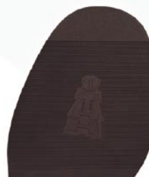
8223 Útah 2–4, tl. 2,8 mm