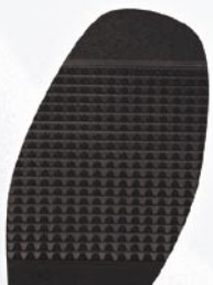
8211 Podrážka D1, D2, H1, H2, tl. 3,5 mm