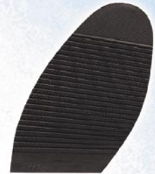
1173 Podrážka 9, 13, tl. 4,5 mm