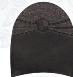
7264 Patník 1–7, tl. 6 mm