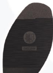
8215 Exclusiv D, H, tl. 2,7 mm