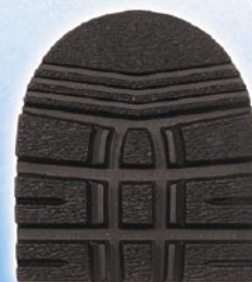
7268 1–6 tl. 6