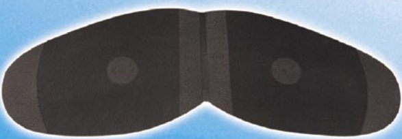
8204 Korunka 5, 7, tl. 2,2 mm