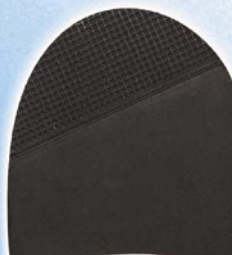
7265 Patník 1–5, tl. 6 mm