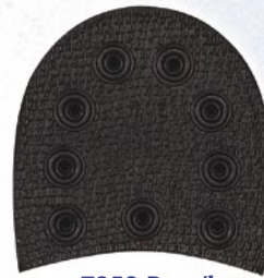
7252 Patník 141–150, tl. 10 mm