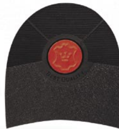
7250 Korunka 162–174, tl. 7 mm