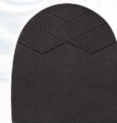
7259 Patník 1–6, tl. 6 mm