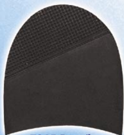
7265 Patník 1–5, tl. 6 mm