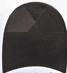
7260 Patník 1–7, tl. 6 mm