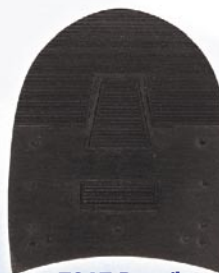
7267 Patník 1–6, tl. 6 mm