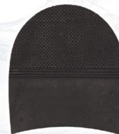
7271 Patník 1–7, tl. 5 mm