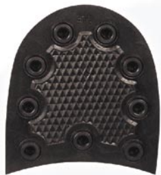
7024 Podpatek 392–398, tl. 10 mm