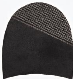
7256 Patník 610–618, tl. 6 mm