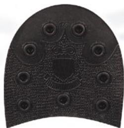
7023 Podpatek 171–176, tl. 15/13 mm