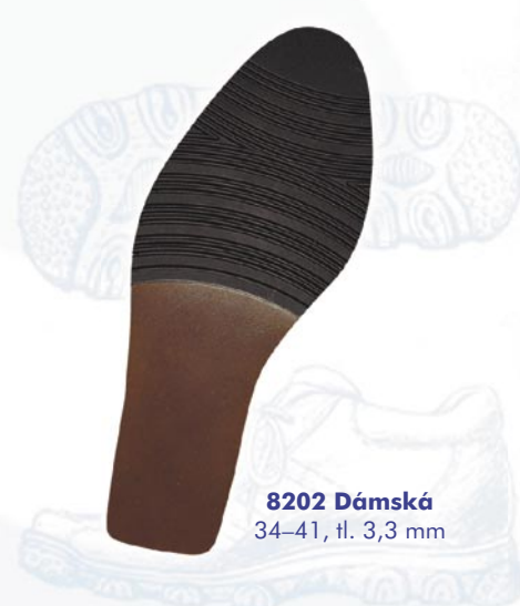
8202 Dámská 34–41, tl. 3,3 mm