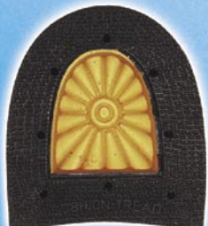
7272 Patník 1–5, tl. 11 mm