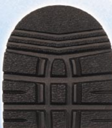
7268 1–6 tl. 6