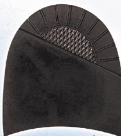
7266 Patník 1–5