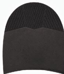
7258 Patník 870–880, tl. 6 mm