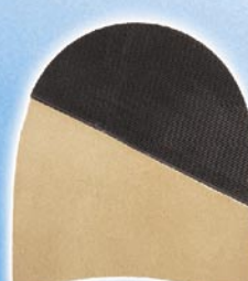
7287 Patník 168–176, tl. 6,5 mm