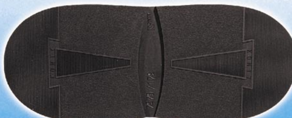
7275 Konty 1, 2, tl. 6 mm