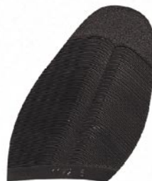
1172 Podrážka 4–10, tl. 2,7 mm