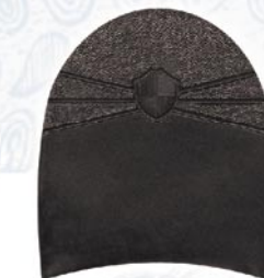
7264 Patník 1–7, tl. 6 mm