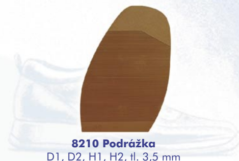
8210 Podrážka D1, D2, H1, H2, tl. 3,5 mm