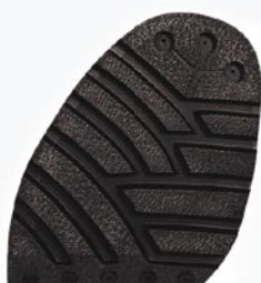
1254 Podrážka 27–33, tl. 9 mm