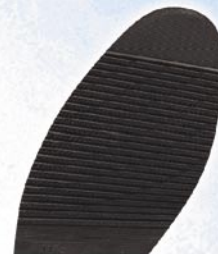
1173 Podrážka 9, 13, tl. 4,5 mm