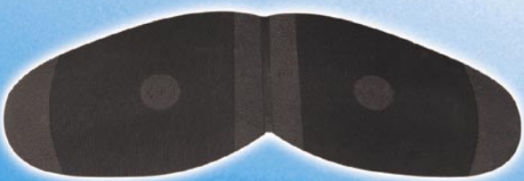
8204 Korunka 5, 7, tl. 2,2 mm