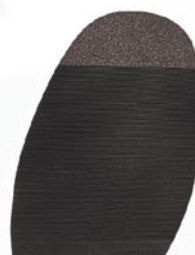
8207 Konty 1–3, tl. 2,5 mm