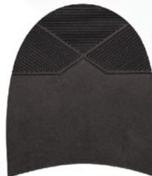
7263 Patník 1–5, tl. 6 mm