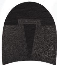
7257 Patník 811–817, tl. 6 mm