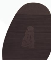
8223 Útah 2–4, tl. 2,8 mm