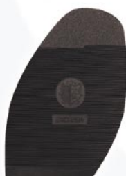
8215 Exclusiv D, H, tl. 2,7 mm