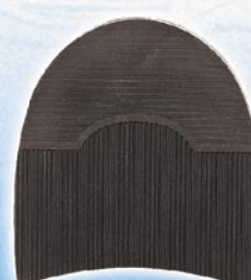
7298 1–5 tl. 12