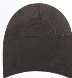
7283 1–6 tl. 6