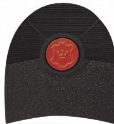
7250 Korunka 162–174, tl. 7 mm