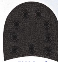
7252 Patník 141–150, tl. 10 mm